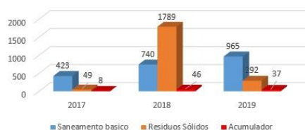
Gráfico 1. Atividades desenvolvidas nos anos de 2017, 2018 e 2019 pela CVSA relacionadas ao Saneamento básico, resíduos sólidos e acumuladores de resíduos no município de Campo Grande, MS.

Aumento nas fiscalizações de coleta e tratamento de Resíduos Sólidos no município.